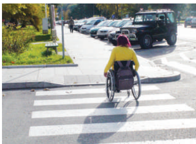
Pločnik ima stopnico, ki predstavlja oviro za osebe na invalidskem vozičku.