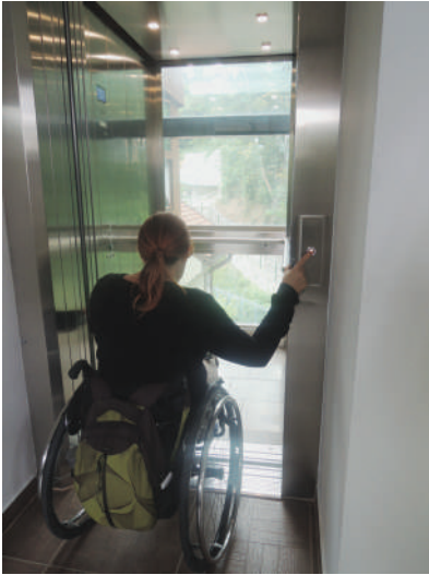
Preozko dvigalo osebi na invalidskem vozičku onemogoča obračanje.